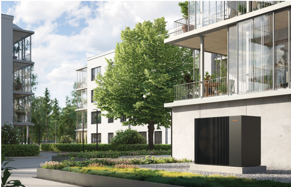
Pompe à chaleur air/eau Vitocal 250-A PRO pour un logement collectif.

Pour les logements collectifs et bâtiments tertiaires.