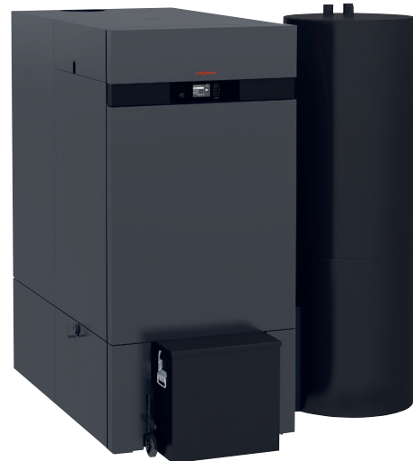
Vitoligno 300-C 80 bis 99 kW

Der Biomassekessel Vitoligno 300-C hat zahlreiche automatische Funktionen, die den Betrieb besonders komfortabel machen. Dazu gehören eine effiziente automatische Zündung mit geringem Stromverbrauch sowie die vollautomatische Entaschung von Rost und Wärmetauscher. Aufgrund der stehenden Anordnung des Wärmetauschers lagert sich nur wenig Asche ab, was lange Reinigungsintervalle ermöglicht. Die Wirbulatoren sorgen für eine dauerhaft effiziente Wärmeübertragung und niedrigere Staubemissionen. Nahezu staubfrei geschieht das Entleeren der großen, verschließ- und fahrbaren Aschebox.