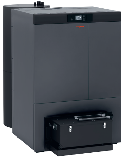
Vitoligno 300-C 60 bis 70 kW