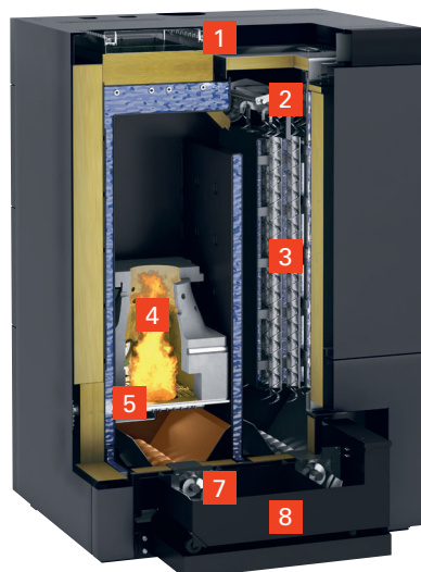
Vitoligno 300-C 60 bis 70 kW