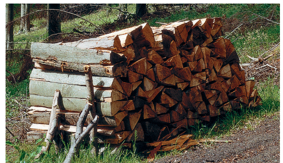
Heizen mit Holz – der natürlichste Brennstoff der Welt

Die Füllraumbreite beträgt 1080 Millimeter und bietet eine komfortable Befüllung auch mit Meterscheiten.